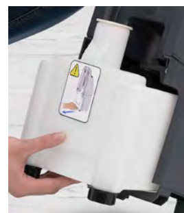
Frischwassertank Art.-Nr. 911500