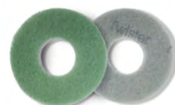
NUC 244NX Diamond Pad, 203 mm Art.-Nr. 912355 (1 VE = 2 Stk.)