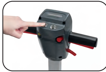
Einfach & klar in der Bedienung – besonders anwenderfreundlich durch farbcodierte Bedienelemente