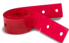
Gummilippen-Set, komplett Art.-Nr. 913810V