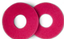
NUC 244NX NU Pad rot, 203 mm Art.-Nr. 912353 (1 VE = 10 Stk.)