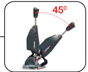
Leicht bewegliche Deichsel – ermöglicht ein ergonomisches und einfaches Arbeiten