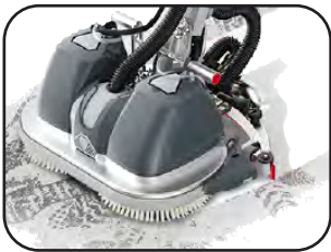
Perfekte Absaugung – sofort trockene Böden.