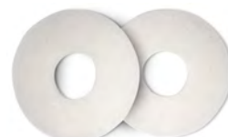
NUC 244NX NU Pad weiß, 203 mm Art.-Nr. 912354 (1 VE = 10 Stk.)