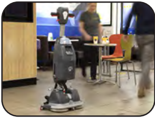
Sicherer Stand durch breite Parkposition