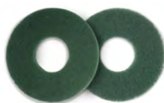
NUC 244NX NU Pad grün, 203mm Art.-Nr. 912352 (1 VE = 10 Stk.)