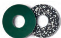
PU Longlife PowerPad 203 mm Art.-Nr. 110011V (1 VE = 2 Stk.)